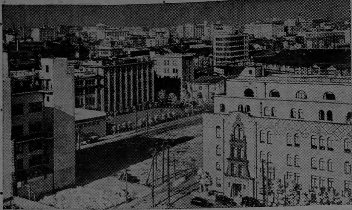
Vista de Tokio, la capital del Imperio Japonés.

Situado 50 varas al Este de la Cantina Chelles SAN JOSE