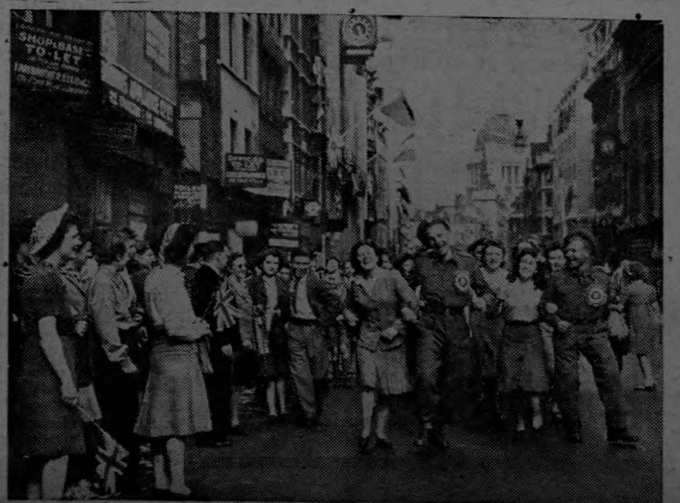
El Día de la Victoria en Europa es celebrado en las calles de Londres.