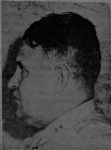
El General Leslie R. Groves Encargado del proyecto de la bomba atómica

Dijo que la utilización de la energía atómica es el "triunfo más descolante de la ciencia en toda la historia," un triunfo que ha logrado "el talento de los hombres de ciencia conglomerando numerosos datos infinitamente complejos que poseían muchos hombres en distintas es-